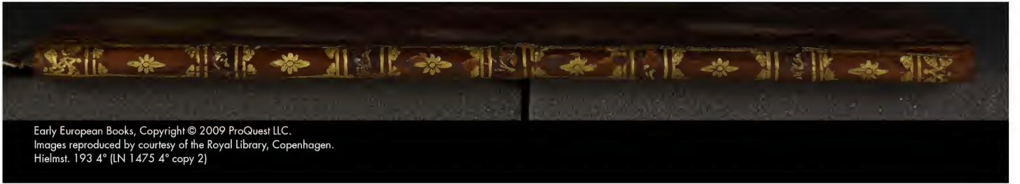
Hielmst. 193 4° (LN 1475 4° copy 2)